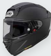
– Matt Black